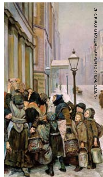
CHR. KROGH'S MALERI «KAMPEN FOR TILVEREISEN»

der umenneskelige livssituasjonen mange hadde. Det var dessverre ikke alltid den offisielle kirken så dette med fattighjelp og forkynnelse til disse utsatte menneskene, som sin oppgave. Mange steder i Europa ble det brudd mellom statskirkene og de engasjerte kristne, som valgte å danne egne trossamfunn. I Norge ledet ikke utviklingen til brudd, men det var ikke statskirken som drev kampen for rettferdighet for de fattige i byene. Det var de da nyopprettede diakonale institusjonene, som startet opp det arbeid som i dag til stor del hører til de kommunale helse- og sosialtjenester, sykehusplasser for alle, pleie, barneomsorg og hjelp til de hjemløse. F.eks har Kirkens Bymisjon og Frelsesarmeen sin opprinnelse i denne tid. Inntrykket den tidens kirke ga, var heller uvilje og bristende evne til å leve opp til Jesu utfordring til oss som menighet og enkeltindivider til å se vår neste og hjelpe den til enhver tid.